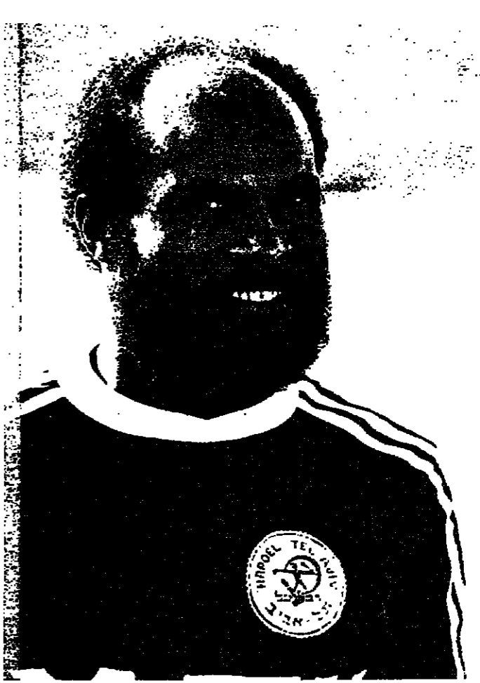
فريق هبوعيل تل ابيب يسجل اصابة على اثر ضربة جزاء ام لصالح على شمشون تل ابيب اصنفر

خسارة كفر قاسم وشباب الناصرة وتأجيل مباراة الاخاء الناصرة مع تل حنان وام الفحم مع نهاريا